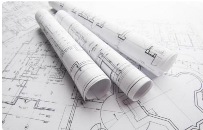
réalisation de plans